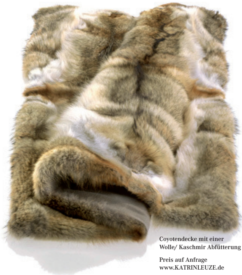
Coyotendecke mit einer Wolle/ Kaschmir Abfütterung Preis auf Anfrage www.KATRINLEUZE.de

Ein Reisekissen mit Schlafmaske und einer Kaschmir-Seiden Stola in einem Reisebeutel. Alles aus einer edlen Satinware.