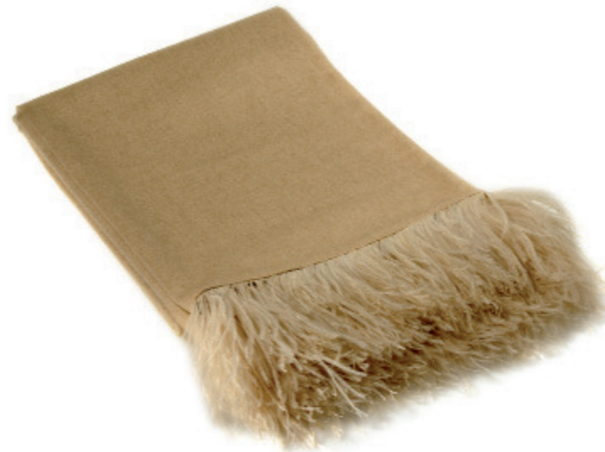
Decke aus 100% Kaschmir mit afrikanischen Straußenfedern Preis auf Anfrage www.KATRINLEUZE.de

Reisetasche aus bedrucktem Ziegenfell in Gepardenoptik